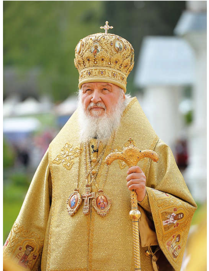
Святейший Патриарх Московский и всея Руси Кирилл.

«Удивительно, как Бог Всемогущий Своё бытие, Свой мир, Свою истину сумел воплотить в словах и категориях человеческой мысли! Как нужно было умалить эту истину, как нужно было приблизить ее к пониманию людей, чтобы она была понятна пусть не всем, но по крайней мере многим! Вот и сегодняшнее евангельское чтение (Лк. 6:31-36) несет нам такую Божественную истину: любите врагов ваших, говорит Господь. Но как эти слова расходятся с человеческим опытом! Ведь это враг — тот, кто хочет тебе зла. Чтобы остановить действие врага, нужно употребить силу: либо силу слова, либо силу человеческих мышц, либо силу тех средств, которыми человек обладает. На этой философии сопротивления силой основана вся философия войны. Именно этими идеями оправдывается пролитие человеческой крови — враг должен быть уничтожен. Любите врагов ваших — откуда эти слова, из какого человеческого опыта, из какой человеческой философии, из какого образа жизни? Нет ничего подобного в человеческом мире. Любите врагов ваших — это как гром с неба, как явление Божие, как явление иного бытия. И когда пылливый человеческий ум начинает проникать в эти слова, открывается вся бездна Божественной премудрости, потому что любовь есть